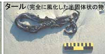
タール(完全に風化した半固体状の物)