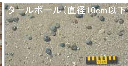
タールボール(直径10cm以下)