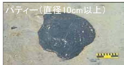
パティール(直径10cm以上)