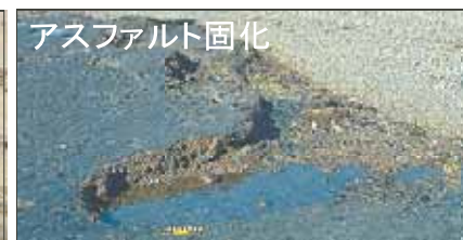
アスファルト固化